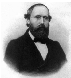
Bernhard RIEMANN (1826-1866)